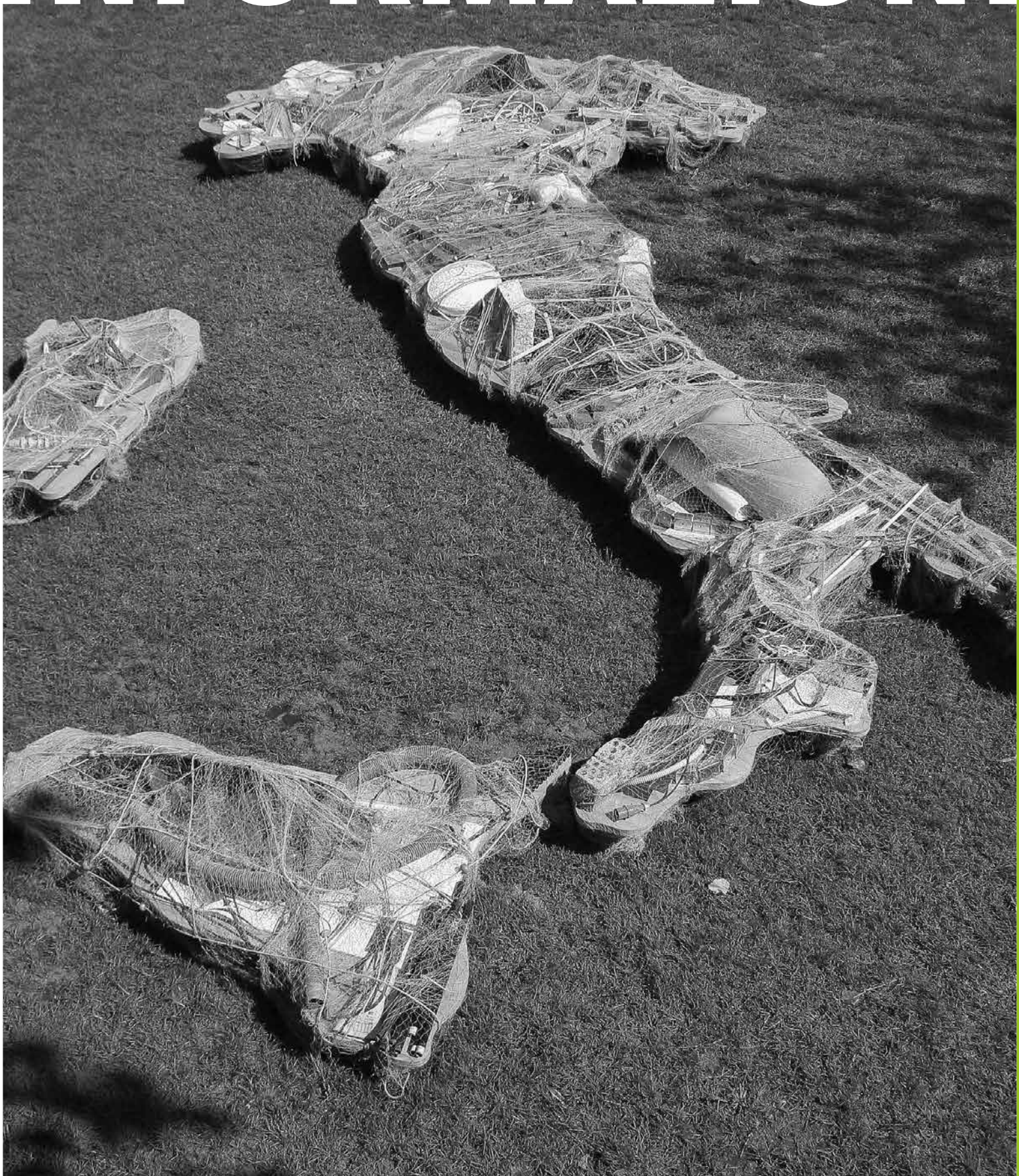
Michelangelo Pistoletto, L'Italia Riciclata , Padiglione Italia - 13. Mostra Internazionale di Architettura della Biennale di Venezia